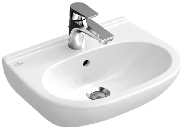
Villeroy&Boch Waschtisch weiß Maße 65x50 cm Sifon und Eckventile ohne Abbildung