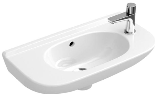
Villeroy&Boch Handwaschbecken weiß Maße 50x25 cm Sifon und Eckventile ohne Abbildung