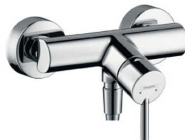
Aufputz Brausearmatur Hans Grohe Talis