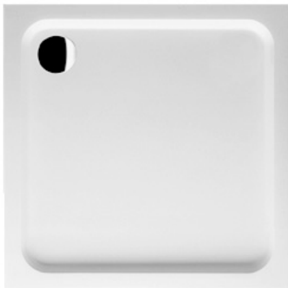
Villeroy&Boch Duschtasse weiß Maße 90x90x6cm mit Ablaufgarnitur, Füße und Wannenprofil