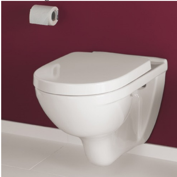
Villeroy&Boch Wandtiefspül-WC weiß mit dazugehörigem WC-Sitz