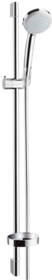
Brausegarnitur Hans Grohe Handbrause Croma, Brausestange Unica inkl. Brauseschlauch und Seifenschale

Folgende Sanitärgegenstände werden standardmäßig entsprechend Plan eingebaut: