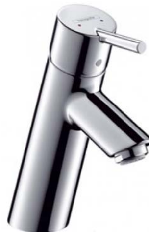
Einhebelmischer Hans Grohe Talis